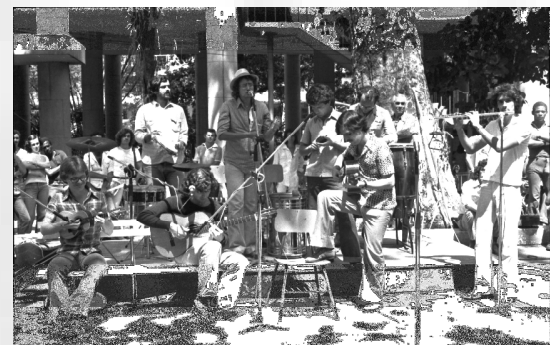
Grupo de choro Coisas Nossas no projeto Quinzena Cultural promovido pela FUNARTE. 1978.

A noção de lugar de memória proposta por Pierre Nora caracteriza um espaço que seja ao mesmo tempo físico, funcional e simbólico. A PUC-Rio é lugar de memória da música brasileira como cenário de eventos musicais que ocorreram ao longo de sua história: início da bossa nova, shows de samba, Projeto FUNARTE, Intervalo Cultural.