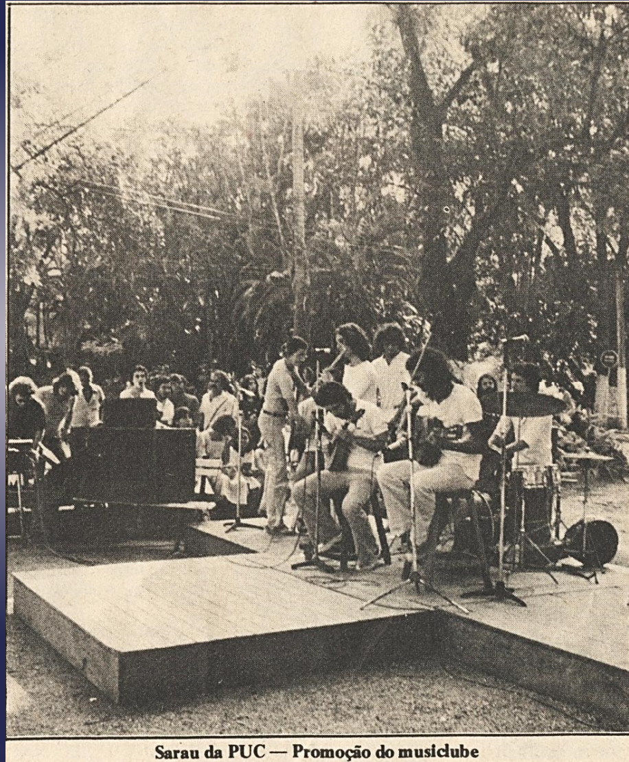
Sarau da PUC — Promoção do musiclube

Sarau no campus da PUC-Rio. c.1979.