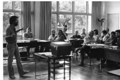
Seminário Interno do CTC – PUC-Rio – 1981.