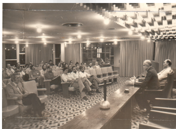
Seminário Interno do CCS – Centro de Estudos do Sumaré – 1979.

Estão catalogados pelo Núcleo de Memória e estarão disponíveis através do site da PUC-Rio.