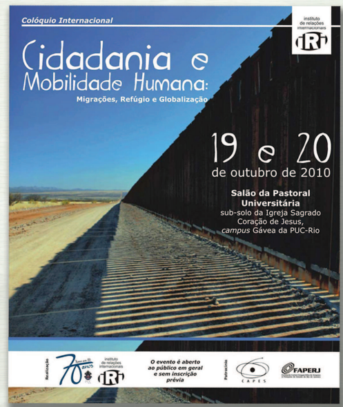
Cartaz de um colóquio internacional promovido pelo Instituto de Relações Internacionais da PUC-Rio (IRI) sobre tema da atualidade. 2010. Acervo do Núcleo de Memória da PUC-Rio.

E assim continuará sendo para que a PUC-Rio seja fiel a si mesma e continue a ser capaz de responder ao que dela espera o país e demanda cada novo momento vivido.