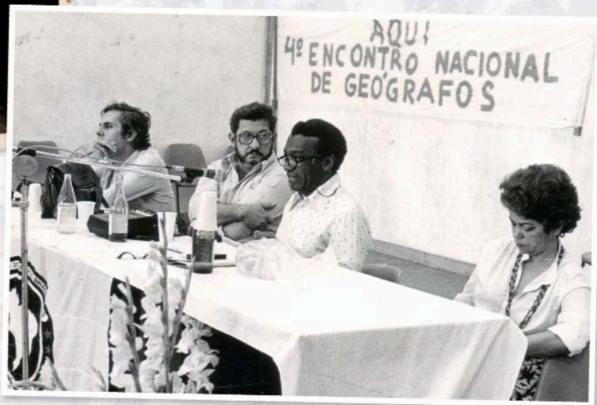
Professor Milton Santos, da USP, no 4º Encontro Nacional de Geógrafos.