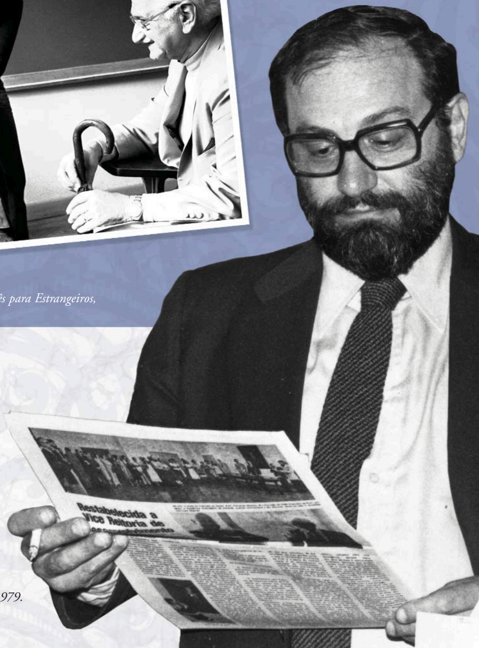
O escritor Umberto Eco, 1979.