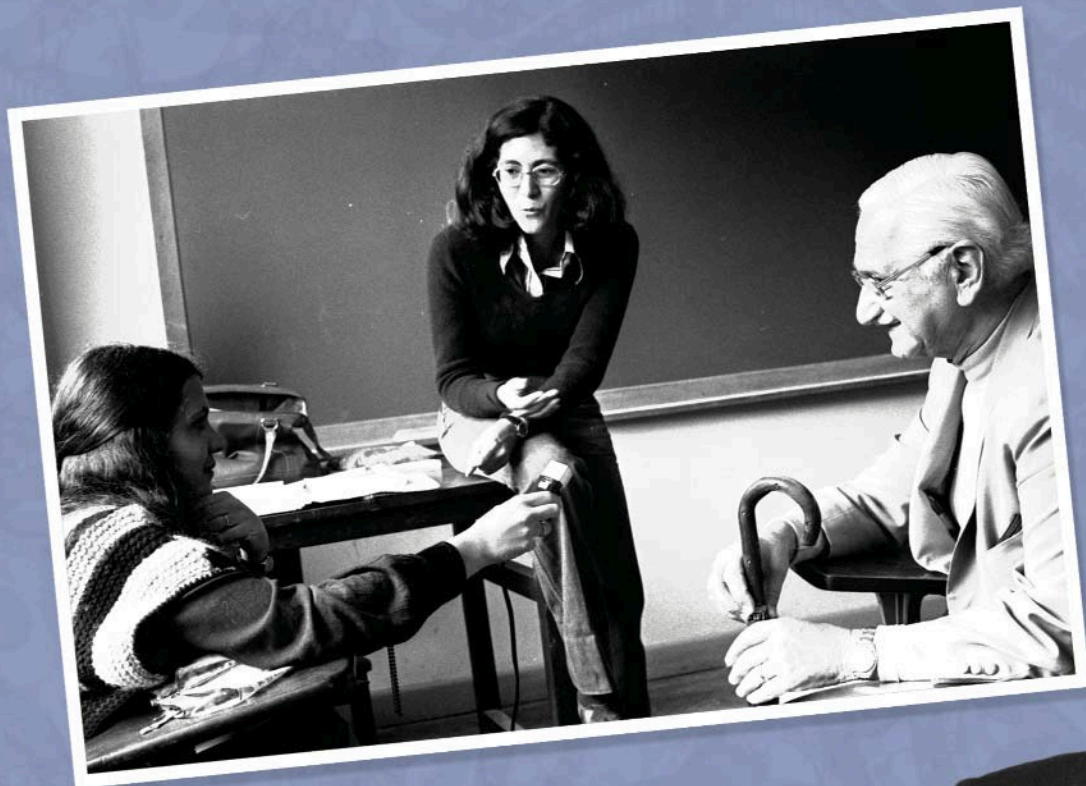
Dr. Albert Sabin como aluno do Curso de Português para Estrangeiros, do Departamento de Letras, 1979.